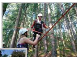
Gemeinsam mehr erreichen ...