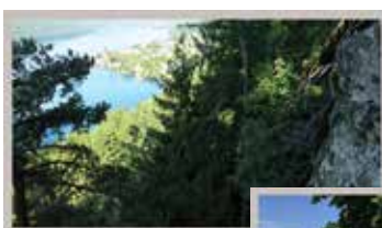
Klettern mit Seeblick

Kaum woanders findet man eine so große Vielfalt von Herausforderungen in der Natur und erfreut sich an den unvergesslichen Erlebnissen in der Gemeinschaft.