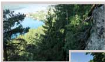
Klettern mit Seeblick

Kaum woanders findet man eine so große Vielfalt von Herausforderungen in der Natur und erfreut sich an den unvergesslichen Erlebnissen in der Gemeinschaft.