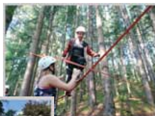
Gemeinsam mehr erreichen ...